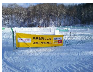
会場設営車両の借上