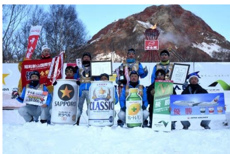
一般の部優勝 でいくさんズ神出

青少年の健全育成や雪国の人々の健康増進、そしてスポーツ雪合戦の普及拡大を目的として、平成29年2月25・26日、スポーツ雪合戦発祥の地である北海道壮瞥町の昭和山山麓特設会場で開催されました。