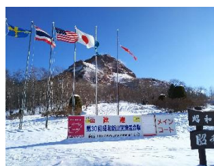
会場内看板の設置