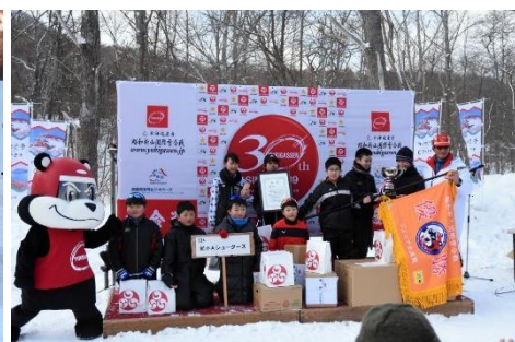
ジュニア交流戦優勝 虻田小Aシューターズ