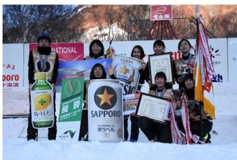
レディスの部優勝 室蘭工大飛鳥